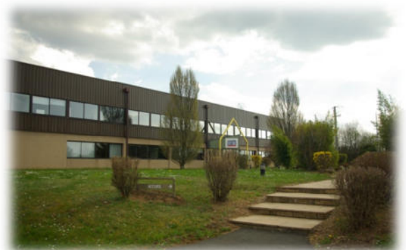
« Martek Power »