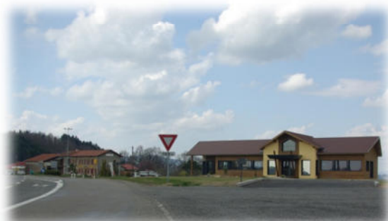
La zone d'activité vue depuis la D4

Source : DGFIP - cadastre 2010; IGN - 2008 Réalisation : SIG Chamousset en Lyonnais